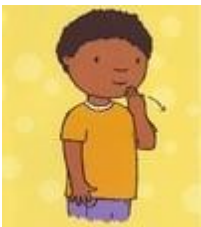
Takk fyrir mig

Tákn með tali (TMT) er tjáskiptaaðferð sem byggir á einföldum hreyfitáknum sem notuð eru á markvissan hátt til stuðnings töluðu máli. Áherslan er lögð á að tákna lykilorð hvarrar setningar. TMT nýtist fólki á öllum aldri sem hefur tal- og málörðugleika af öðrum orsökum en heyrnarleysi. Undanfarin ár hefur komið í ljós að aðferðin nýtist vel í fjölmenningslegu umhverfi til dæmis í leik- og grunnskólum. Aðferðin er málörvandi fyrir öll ung börn og því óhætt að hvetja foreldra og kennara ungra barna að nota TMT sem skemmtilegt málörvunartæki sem um leið hjálpar þeim sérstaklega sem á þurfa að halda.