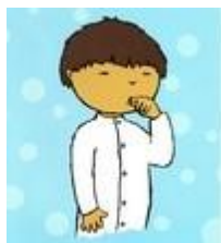
Ég vil borða