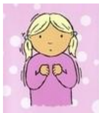
Mér er kalt

TMT er ávallt notað samhliða tali enda er markmiðið að kenna viðkomandi að tjá sig og skilja íslenskt talmál. Táknin gera málið sýnilegt og styðja þannig við töluðu orðin. Táknin vara lengur en orðin sem hverfa um leið og þau eru sögð. Það gefur viðkomandi lengri tíma til að skilja það sem sagt er. Táknin eru oftast myndræn og lýsandi og því auðskilin. TMT er í raun eðlilegt framhald af